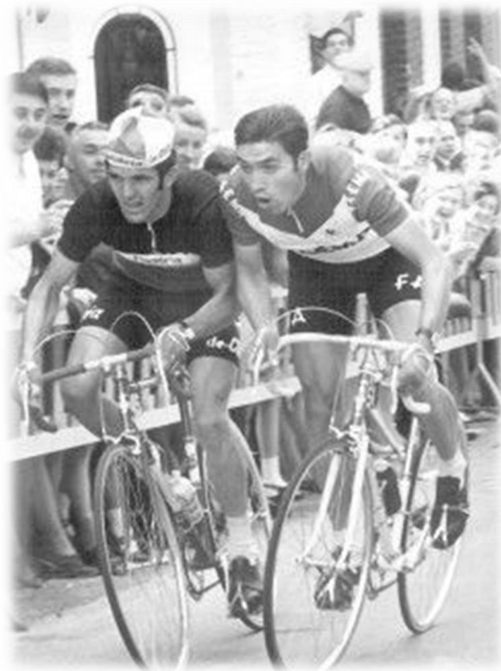
Het ultieme duel...

Naar jaarlijkse traditie zijn er naast de wekelijkse zondagsritten ook de supercupritten op zaterdag, waarin de nodige blauwe en/of groene bolletjes kunnen verzameld worden.