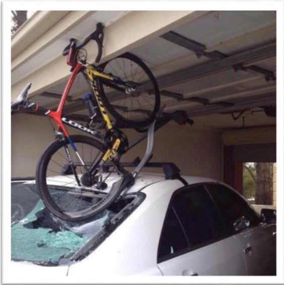
Effe pech, Alois!