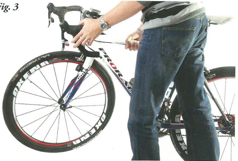
Voorwiel optillen en met andere hand het stuur langzaam links en rechts bewegen en voelen of alles soepel genoeg loopt.