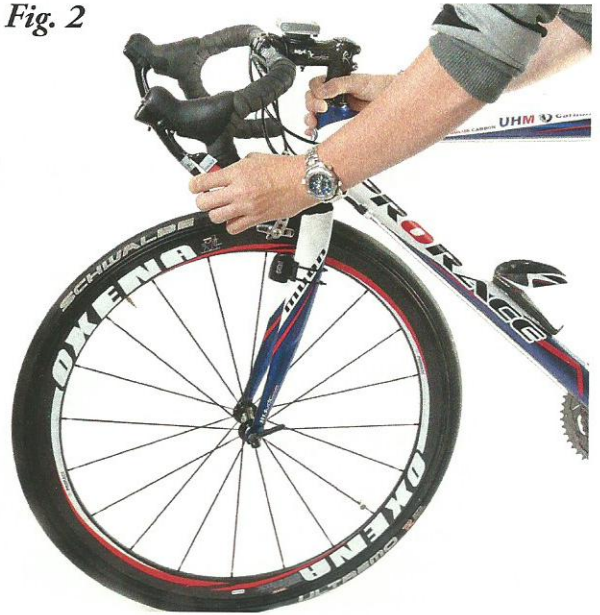
idem als hiernaast en dan met rechter hand de speling voelen op het balhoofd.

Je voelt dan heel vlot als er ook maar de minste speling is.