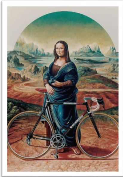
Daarom was de Mona Lisa zo gelukkig...